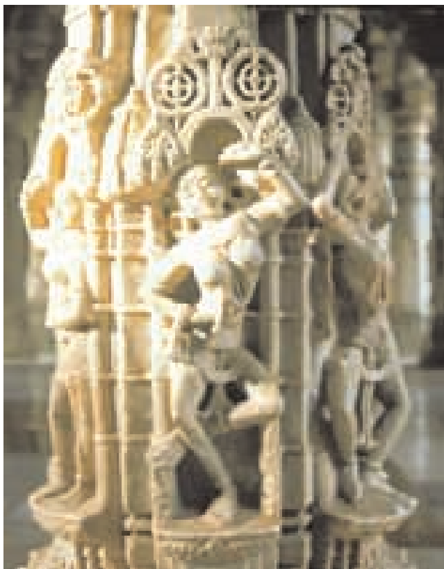
Část sloupu zobrazující tanečnický v chrámu Dilwara v Mount Abu v indickém Rádžasthánu.

Ve dvacátém století vznikla v rámci digambaršského džinismu instituce kleriků. Bhattaraci („ctihodní“) procházeli jen minimálním asketickým zasvěcením. Spravovali chrámový rituál, dohlíželi na přísahy laiků a na jejich náboženskou výchovu a udržovali knihovny. Bhattaraci rovněž působili jako vyslanci džinistických komunit u ostatních náboženských a politických autorit. Džinisté jim vděčí za vyjednání politické ochrany a prosazování džinismu šířením vzdělanosti a knih. Instituce bhattaraků však ve zpětném pohledu působí jako emblém duchovního úpadku, poněvadž jejich nároky na náboženskou autoritu nedokládala mravní autorita asketického odříkání. Na počátku dvacátého století se většina z třiceti šesti postů bhattaraků vyprázdnila.