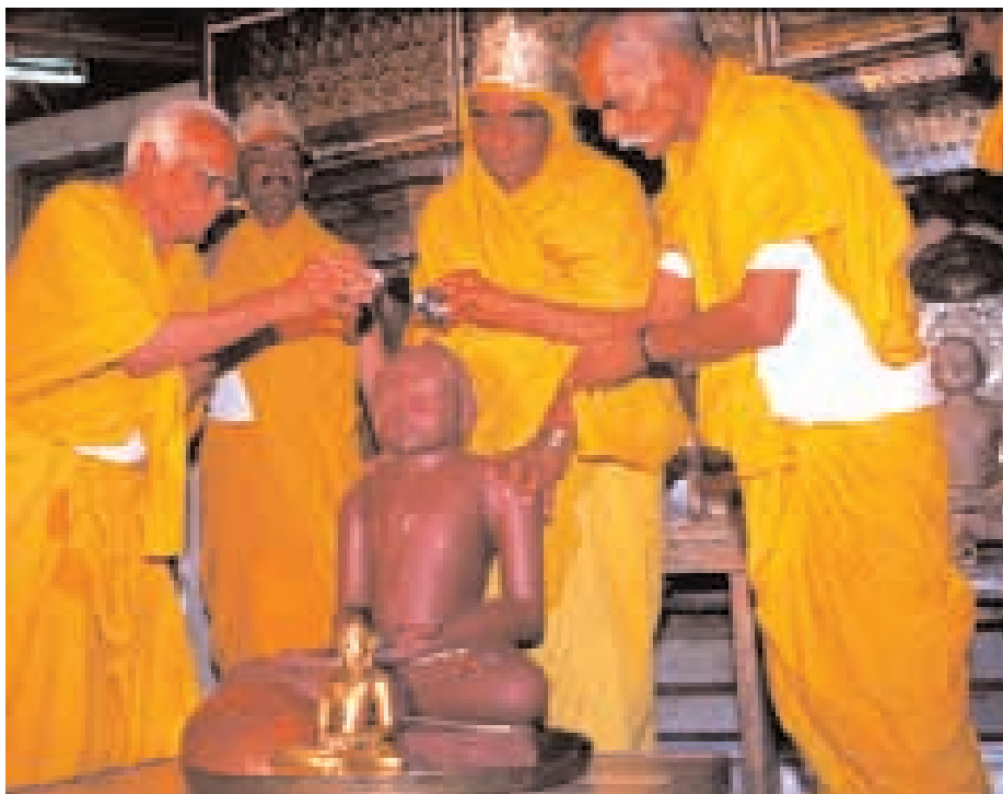
Džinisté omývají sochu Pána Mahávíry mlékem a vodou.

Mahávírův životní příběh a učení zachycují džinistické spisy. Kalpasútra popisuje, jak se po Mahávírově předchozím vtělení do nebeské bytosti Indra (král bohů) postaral o to, aby se Mahávíra přesunul do lůna své matky. Švétámbarský džinismus tvrdí, že Mahávíra byl omylem dopraven k bráhmanské ženě, dříve než dorazil ke své zamýšlené matce Trisale, jež byla ženou krále Siddhárthy. Džinové se vždy rodí v kastě válečníků a aristokratů (na rozdíl od védské kultury, kde byli svatí muži vždy bráhmani). Význam Mahávírova vzdání se světa je zvláště rozkošnickým životem, který opustil. Trisala měla během