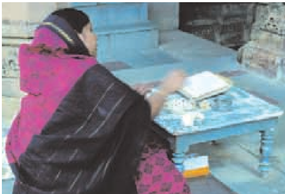
Džinistka provádějící každodenní rituál „pudža osmi substancí“.

■ Na konci rituálu věřící znovu řekne „nisihi“, může se na chvíli pohroužit do duchovní kontemplace a při odchodu obvykle zazvoní na zvonec.