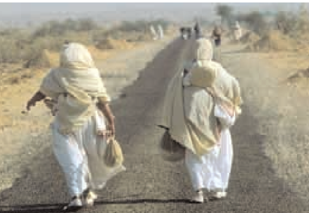
Putující žebravé jeptišky netráví na jednom místě více než dva tři dny.

ních. Nad sedmi říšemi pekla je střední oblast, mádhja loka , nejmenší kosmická oblast a sféra lidského pobývání. Nad mádhja loka je sedm nebeských říší obývaných nebeskými bytostmi, jež žijí v přepychu a nádheře díky chvályhodné karmě , která jim připadla v minulých vtěleních. Na samém vrcholu kosmu je siddha loka , známá též jako isatpragbhara (lehce se zakřivující místo), kde duše osvobozené od karmy přebývají ve stavu mókšy .