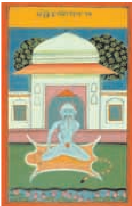
Indická miniatura z osmnáctého století zobrazující jogína, který se zkríženými nohama sedí na zvířecí kůži.

● Dharma („držet, nést“) je mravním a metafyzickým základem univerza. Jednání v souladu s vlastní dharmou (kterou nelze vždy snadno určit) spojuje lidské jednání a život se společenskou strukturou a prostředním. Plnění dharmických