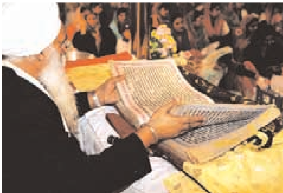
Guru Granth Sáhí předčítaný sboru.

Proces sjednocování bání s guru začal guru Nának a pokračovali