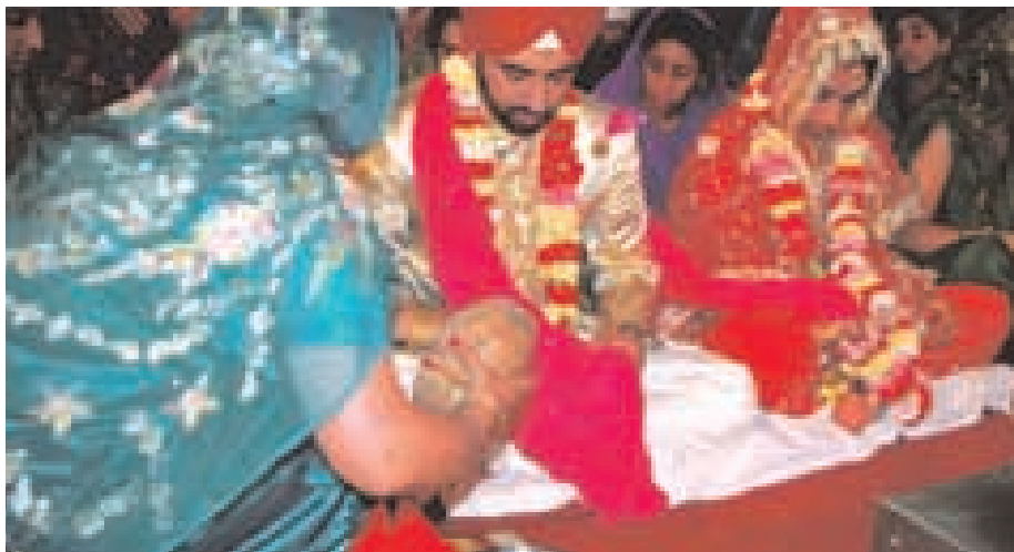
Nevěsta s ženichem sedící před posvátným spisem.

● Ánand karadž končí přednesem hymnu Ánand sáhib a Ardásem .