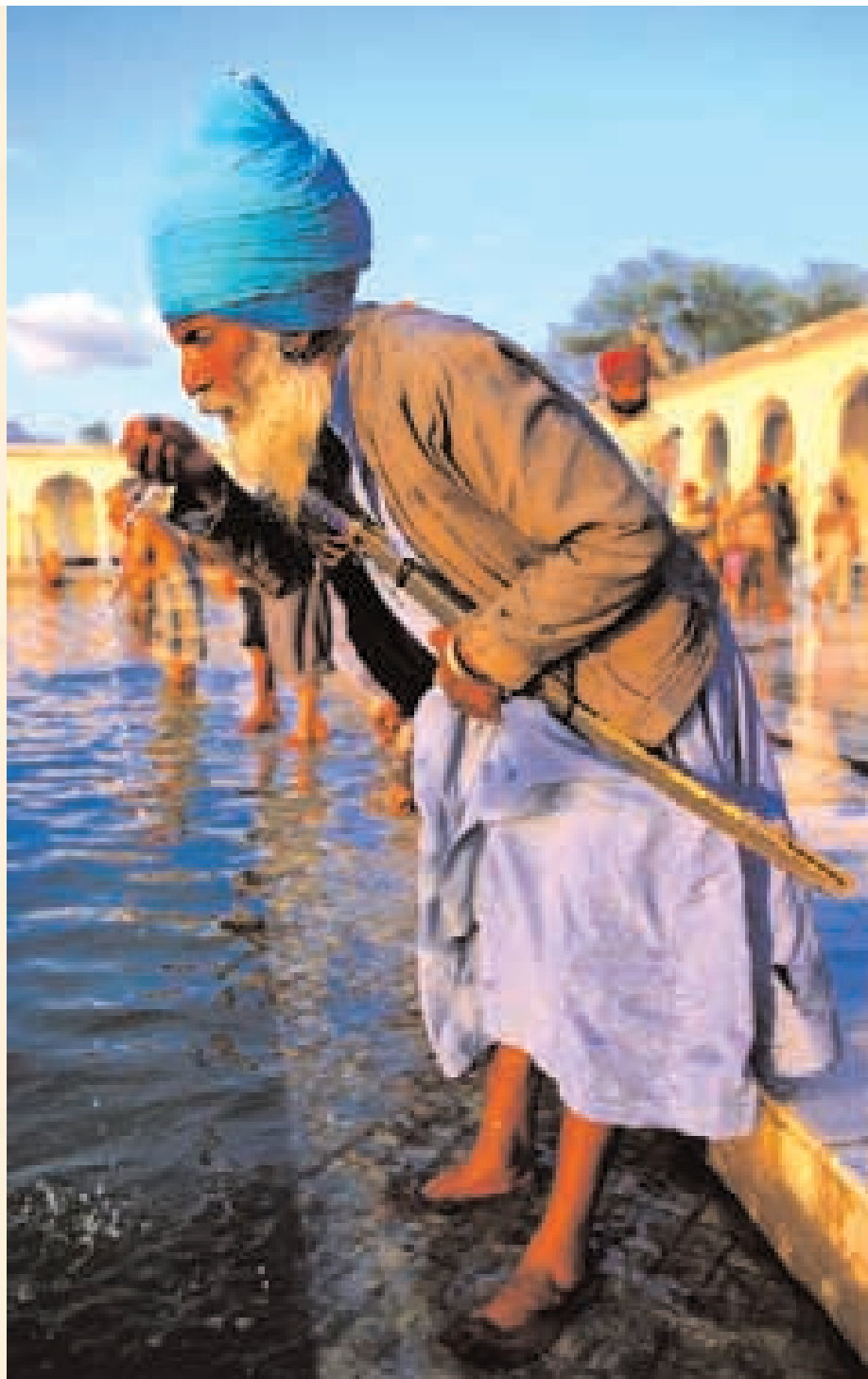
Sikh se rituálně omývá v Anandpur Sáhíb v Indii.

opakovaně zdůrazňoval, že spravedlivý život není zárukou spásy, poněvadž příchod Pravého guru k jakémukoli jedinci závisí na přízni Nesmrtelné bytosti. Je ovšem