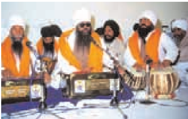
Oslava v gurudváře Amandas Raggis v londýnské Southall.

věznil mughalský vládce Jahangir. Při návratu guru do Amritsaru rozžehli jeho stoupenci po celém městě svíce a lampy. V dnešní době probíhají v gurudvářích speciální bohoslužby zpodobující osvobození guru Hargóvinda a potvrzující specifickou sikhistickou totožnost. Gurudváry i lidské příbytky se zdobí svíčkami a zapalují se ohňostroje. Vrcholem oslav Díválí je osvětlení Zlatého chrámu ( Hari-mandir ).