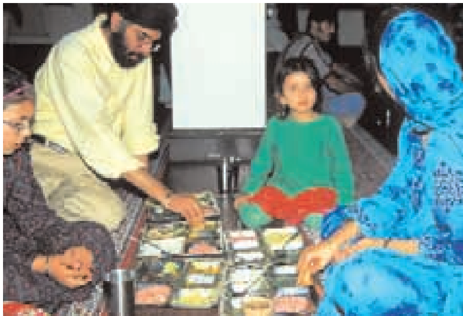
Sikhistická rodina v Londýně, která jí langar po nedělní bohoslužbě v gurudváře.