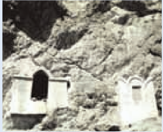
Jedna ze zoroastrovských svatyní v Yazdu.

V dnešním světě je společenství i náboženství neustále vystaveno silnému tlaku, aby se změnilo; a v tomto prostředí my párové jako lidé zakořenění ve starověkých praktikách bojujeme za udržení starého způsobu života. Proto se v životě snažím předávat pochopení víry mladým pársům po celém