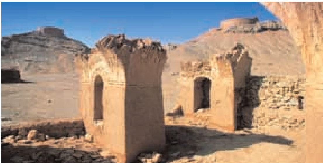
Dakhme-ye Zartoshi, známé též jako Věže mlčení v iránském Yazdu; zde nechávali pársové těla svých mrtvých napospas dravým ptákům.

a nemá být ani nenasytný, aby tělo nepřevážilo nad duší. Zdraví těla a duše je vzájemně provázané a měli bychom se o ně starat stejnou měrou.