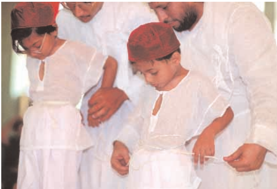
Párští kněží pomáhají děvčeti a chlapci při navjote, rituálním uvazování posvátného provázku, kuští , kolem pasu.

Rituál jasna vyvolává panteon duchovních bytostí známých jako jazatas . Během liturgie se čte 72 kapitol Jasny a jazatové se